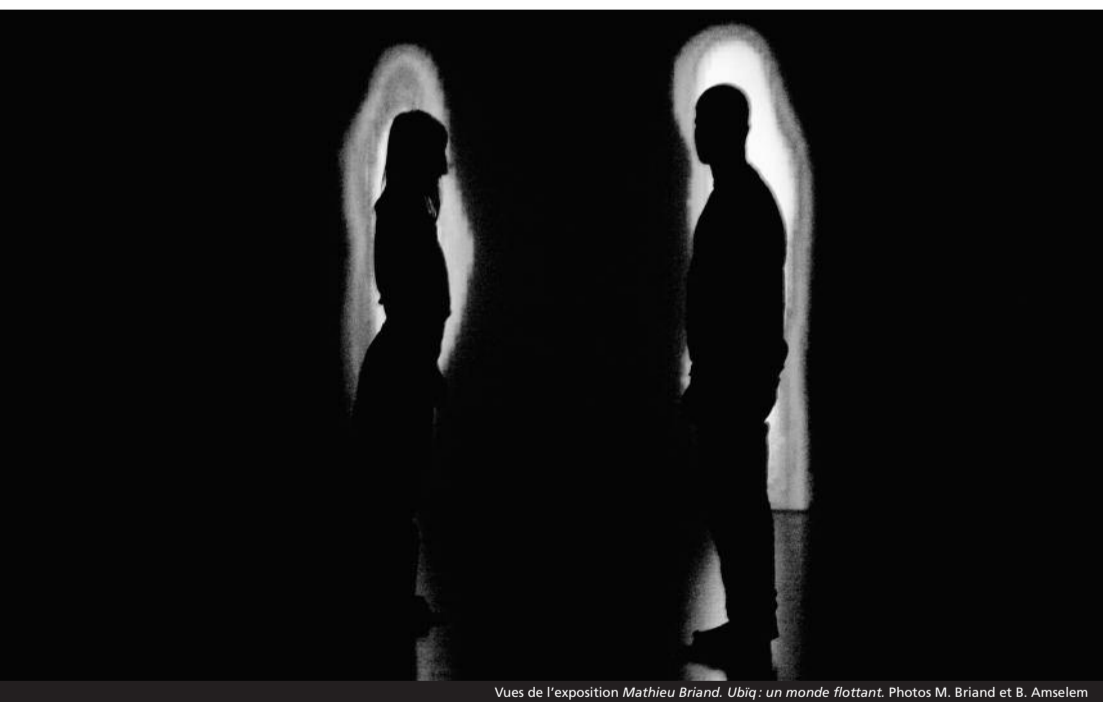
Vues de l'exposition Mathieu Briand. Ubiq: un monde flottant .